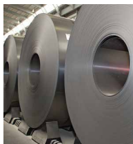
Ternium Rolado en Caliente y Rolado en Frío®