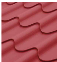
Ternium Galvateja Plus®