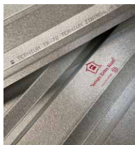
Ternium Zintro Alum®