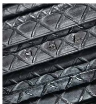
Ternium Varilla y Alambrón®