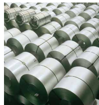
Lámina rolada en caliente y frío