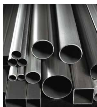
Ternium Tubería y Perfiles®