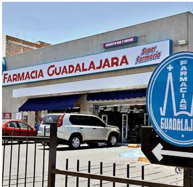
■ Farmacias Guadalajara donó equipos a Funsalud.